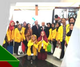
Beasiswa DKI JKT