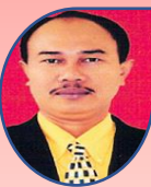
Alumni ALTRI/STIH Litigasi SUBUR MS, SH., MH KETUA PTUN SURABAYA